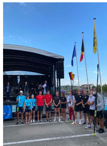
... Info Service Belgium naast ons