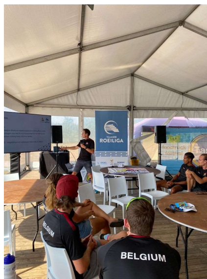
... we op 1 september een